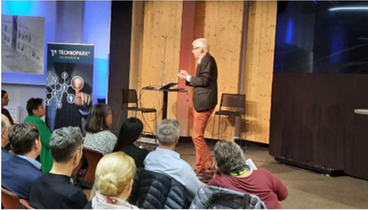
Infoveranstaltung vom 15. Februar 2024