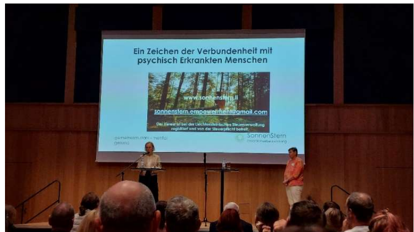
Welttag der psychischen Gesundheit am 10. Oktober 2024